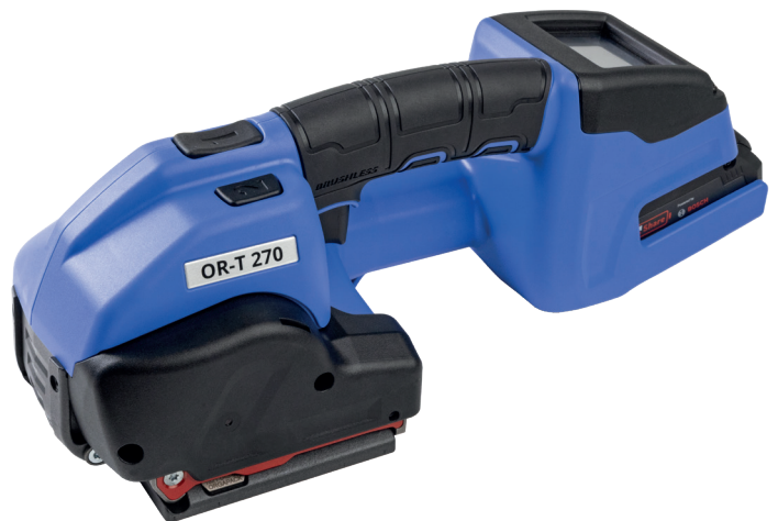
OR-T 270 Για καθολική εφαρμογή