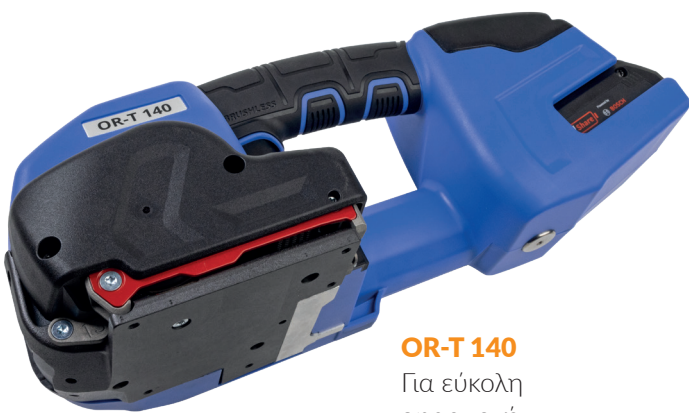
OR-T 140 Για εύκολη εφαρμογή