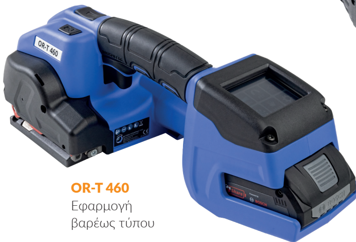
OR-T 460 Εφαρμογή βαρέως τύπου